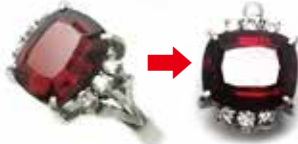
Pm900ガーネットリングを