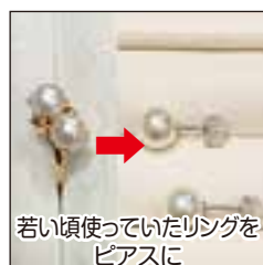
若い頃使っていたリングをピアスに