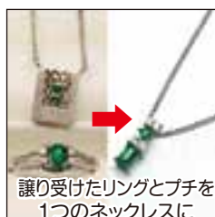
譲り受けたリングとブチを1つのネックレスに