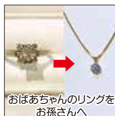
おばあちゃんのリングをお孫さんへ